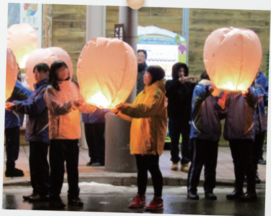
スキー研修 (スカイランタン)