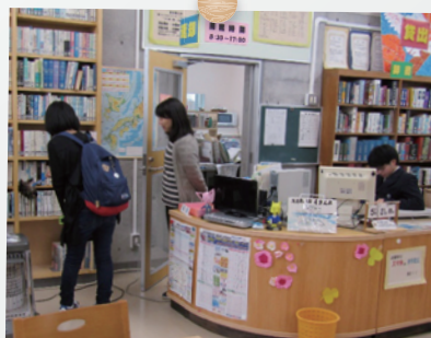
図書委員会の活動