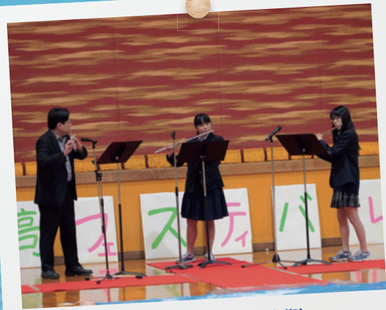
西高フェスティバル (文化祭)