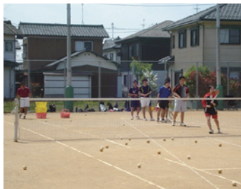
ソフトテニス部 練習風景

A5 若干の変更はありますが、スポーツフェスティバル・西高フェスティバル(文化祭)などを行っています。部活動も、運動部・文化部で生徒たちが有意義な活動をしており、全国大会や北信越大会に出場する部活もあります。