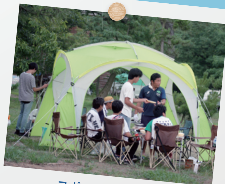
スポーツV (野外体験)