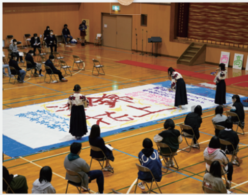
西高フェスティバル (文化祭)