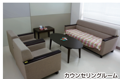
カウンセリングルーム